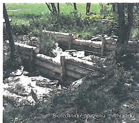
Biotechnické opatrenia - prehrádzky

chých poldrov predstavujú dva objekty nad obcou Lubica, dva nad obcou Kolačkov a taktiež dva nad obcou Lomnička. Následne tri objekty budú na tokoch nad obcou Ihlany, jeden nad obcou Jakubany a jeden nad obcou Tichý Potok. Z projektu boli vypustené dve stavby nad obcou Tichý Potok a jeden nad ob-