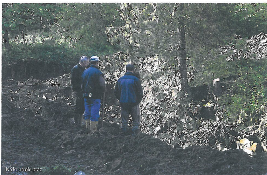
Ná kontrolu prác