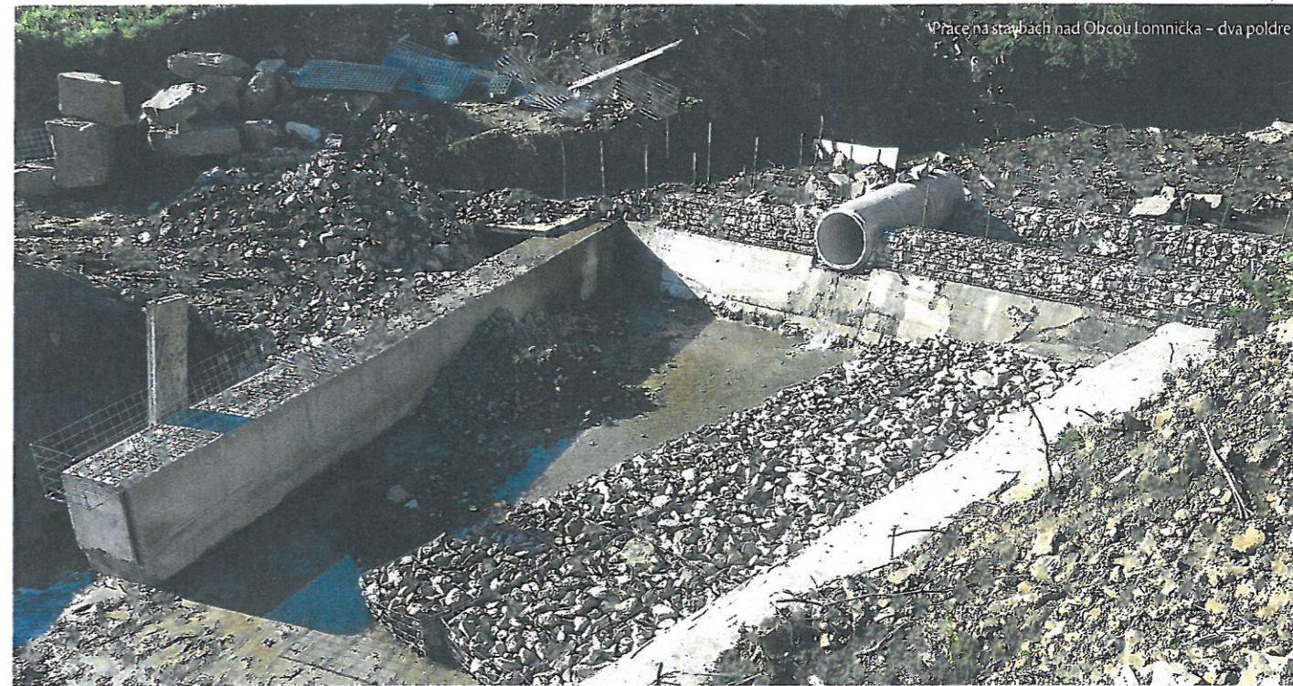
Práce na stavbách nad Obcou Lomnička - dva poldre

chých poldrov predstavujú dva objekty nad obcou Lubica, dva nad obcou Kolačkov a taktiež dva nad obcou Lomnička. Následne tri objekty budú na tokoch nad obcou Ihlany, jeden nad obcou Jakubany a jeden nad obcou Tichý Potok. Z projektu boli vypustené dve stavby nad obcou Tichý Potok a jeden nad ob-