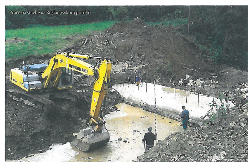
Práce na stavbe na Ruskinovskom potoku

Do procesu výstavby protipovodňových objektov v oblasti Levočských vrchov sa výraznou mierou zapojí aj Slovenský vodohospodársky podnik, š. p. Banská Štiavnica. Vyvrcholením a uzavretím týchto stavebných prác na PPO by mali byť suché poldre, ktoré svojim rozsahom predstavujú už menšie vodné dielo. Celkovo SVP, š. p. zrealizuje štyri poldre - dva nad obcou Lubica, na vedľajších menších prítokoch Lubického potoka v lokalite Homérova dolina, ďalší nad obcou Tvarožná a konečne najväčšiu stavbu zrealizuje nad obcou Lubica, miesta časť Pod lesom. Hrádza tohto líniového objektu bude vysoká 18,5 m a široká 350 m. Tieto stavby realizuje v najbližšom období Slovenský vodohospodársky podnik, š. p. z vlastných zdrojov, pričom rozsah prác predstavuje objem finančných prostriedkov na úrovni 25 miliónov eur.