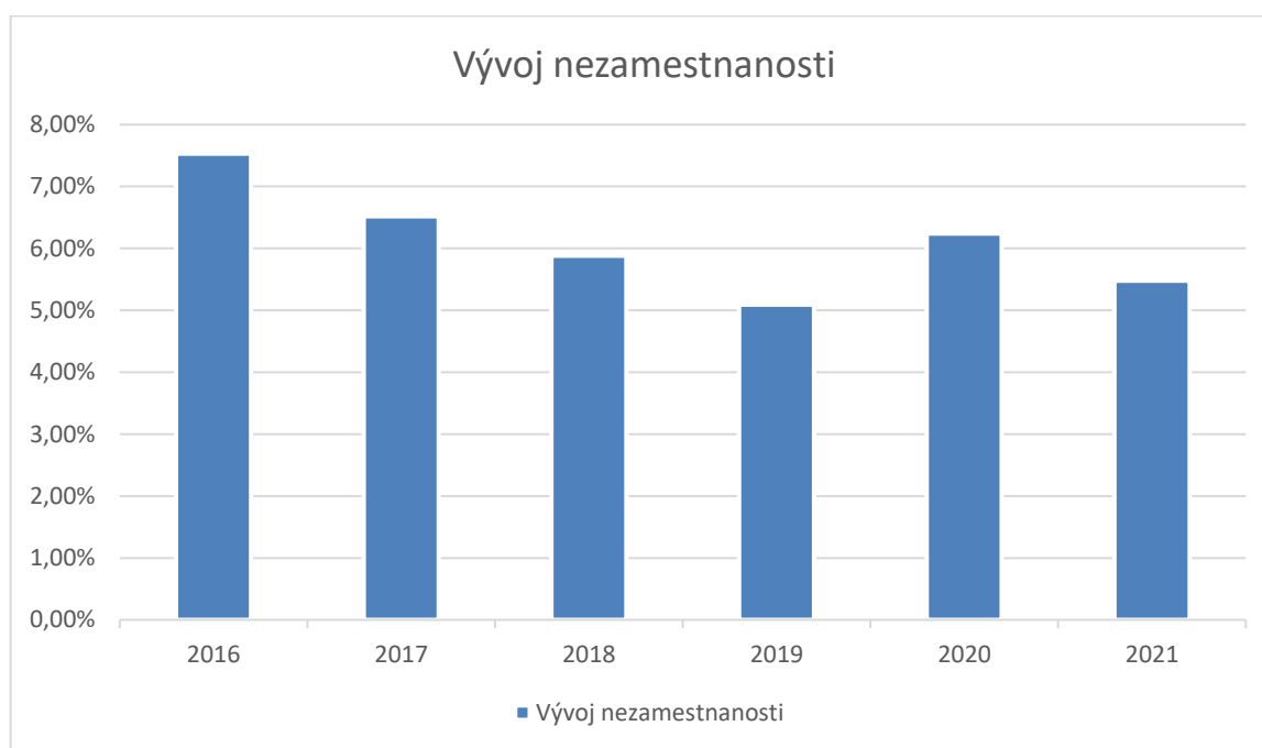
Graf č. 2 – Vývoj nezamestnanosti

Obec Jakubany mala v roku 2021 5,48% nezamestnanosť, avšak tento údaj je relevantný, vychádza z údajov ÚPSVaR a ekonomicky aktívneho obyvateľstva za rok 2021, nezahŕňa však celkový počet dobrovoľne nezamestnaných, prípadne osôb pracujúcich v zahraničí, pretože tieto údaje obec neviduje.